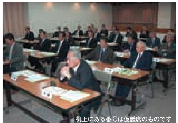
机にある番号は仮議席のものです