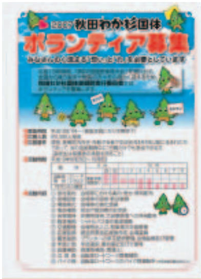
ボランティア募集チラシ(登録申込書)が各家庭に配布されます!

平成19年開催の「第62回国民体育大会」を盛り上げ、全国から集う選手や観客の方を心温かく迎えるため、ボランティアを募集します。