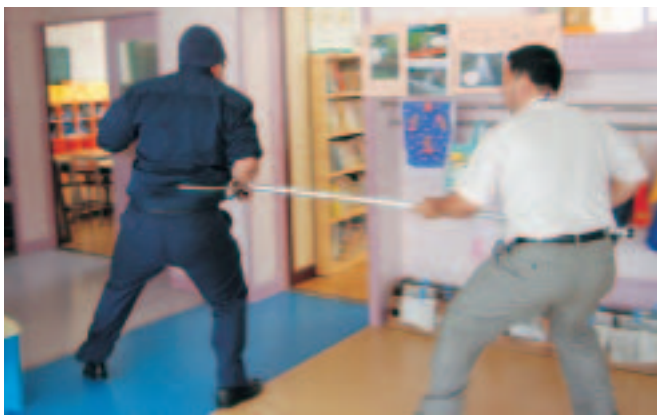
▲校内への不審者侵入を想定した避難訓練も行われている

登校時は集落単位による集団登校とし、下校時は子どもたちをできるだけ限り一人で下校させないように、学年単位や低学年による集団下校としています。そして、もし下校途中など知らない人に声をかけられても絶対についていけないこと。近くの民家やお店などがあれば飛び込むようにして助けを求めるように指導しています。