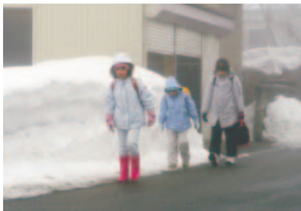
▲登校時は集落単位での「集団登校」としている

登校時は集落単位による集団登校とし、下校時は子どもたちをできるだけ限り一人で下校させないように、学年単位や低学年による集団下校としています。そして、もし下校途中など知らない人に声をかけられても絶対についていけないこと。近くの民家やお店などがあれば飛び込むようにして助けを求めるように指導しています。