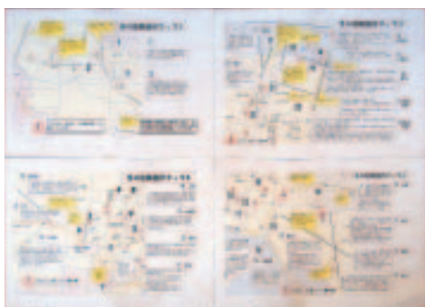
▲各学校では「通学路安全マップ」などを作成し危険箇所を指導している

また、「通学路安全マップ」を作成し、子どもたちが実感を持って危険箇所を認識するよう指導しています。