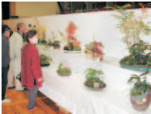
▲美郷フェスタでの押し花体験コーナー(上)と園芸コーナー(右)

楽しみながら自分を高める生涯学習は、いきいきと充実した生活をおくるために欠かせないものです。町内には文芸、絵画、手芸、舞踊をはじめとして、学習を深めている団体がたくさんあります。興味を持たれたらぜひ体験してみてください。どの団体もあたたかく迎えてくれるはずですよ。