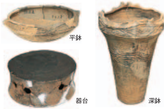
発掘調査で出土した土器

一丈木遺跡は、主に縄文時代中期中頃に、『一丈木ムラ』としてこの地域の中心的な役割を果たした遺跡です。昭和五十一年、県史跡指定となり、現在では史跡公園として竪穴住居を復元し活用されています。また、発掘調査で出土しました土器や石器は郷土資料館に展示しています。