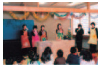
千畑交流センター