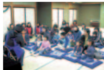
仙南交流センター

「読み聞かせ会」は毎月開かれていますので、ぜひご参加ください。日時等は広報お知らせ版等に掲載しています。