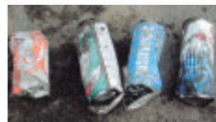
爆発の原因と思われるカセットガスボンベ。破裂して底が抜けている。

問い合わせ 役場(千畑庁舎)住民生活課 環境安全班 ☎0187(84)4903(内線2144)