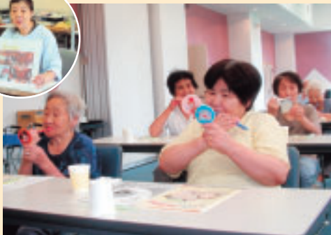
▲健口教室(お口の健康教室)