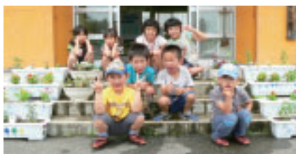
みんな、見に来てね！