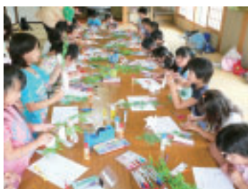
★みんな願い事叶うといいね★