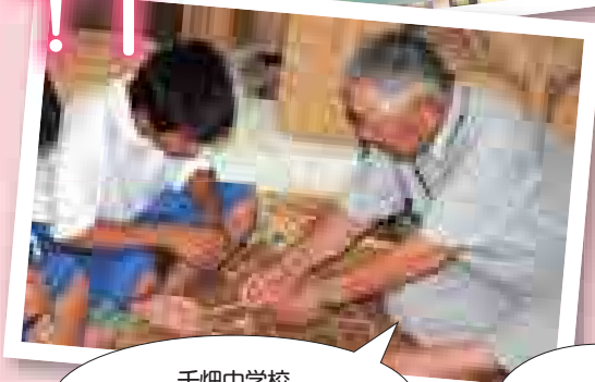
千畑中学校 「総合的な学習～わら細工～」