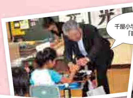
千屋小学校4年生 「書写」