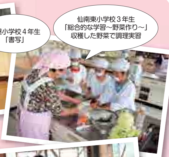
仙南東小学校3年生 「総合的な学習～野菜作り～」 収穫した野菜で調理実習