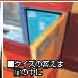
■クイズの答えは扉の中に