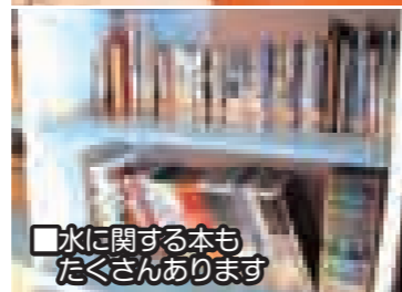
■水に関する本もたくさんあります