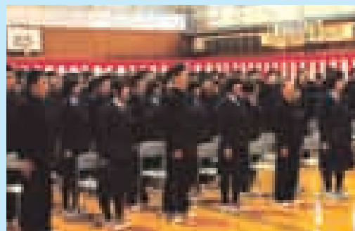
▲出席者全員で校歌を斉唱

昭和35年に金沢西根、飯詰、金沢中学校が統合して誕生した仙南中学校。52年の歴史に幕を閉じることになりますが、平成25年4月からは仙南小学校の校舎として再び新しい歴史を刻んでいきます。