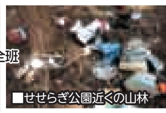
■せせらぎ公園近くの山林

■町住民生活課 環境安全班 ☎0187(84)4903 ■大仙警察署 ☎0187(63)3355