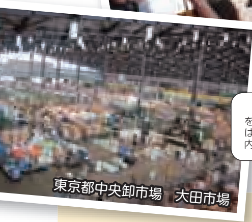
東京都中央卸市場 大田市場