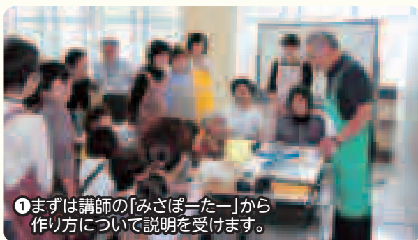
①まずは講師の「みさぽーと」から作り方について説明を受けます。

講座当日は形づくり、絵付けまでの作業を行いました。全員が同じ種類、重さの粘土を使用しているとは思えないほど、個性的なコーヒーカップが出来上がりました。