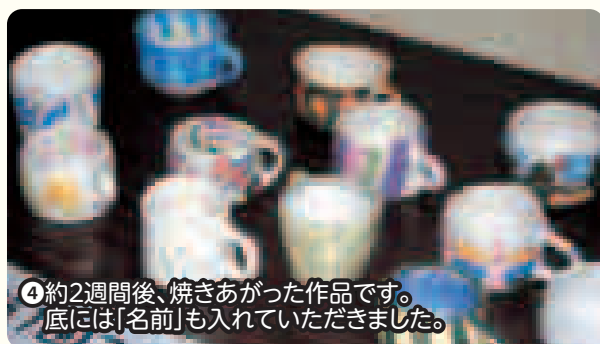
④約2週間後、焼きあがった作品です。底には「名前」も入れていただきました。