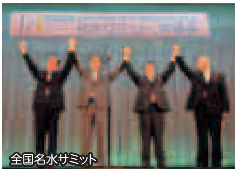
全国名水サミット