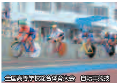
全国高等学校総合体育大会 自転車競技