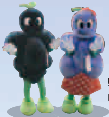
巨峰の王国まつり マスコットキャラクター 巨ん太&ぷるる

長 野県東御市は、小県郡東部町と北佐久郡北御牧村の2町村が合併して、平成16年4月1日に誕生しました。長野県の東部に位置し、北は上信越高原国立公園の浅間連峰を背に、中央に千曲川の清流、南に蓼科山を望む台地が広がる、自然に恵まれた美しい市です。