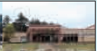
湯とぴあ雁の里温泉 美郷町飯詰字東西法寺181-2 ☎0187-83-3210