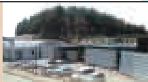
千畑温泉サン・アール 美郷町金沢東根字仏沢210-1 ☎0187-84-3983