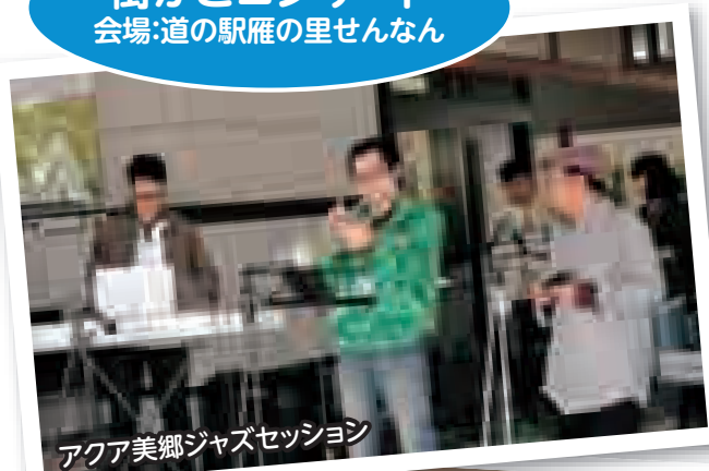
アクア美郷ジャズセッション