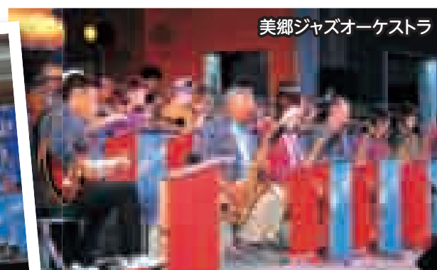
美郷ジャズオーケストラ