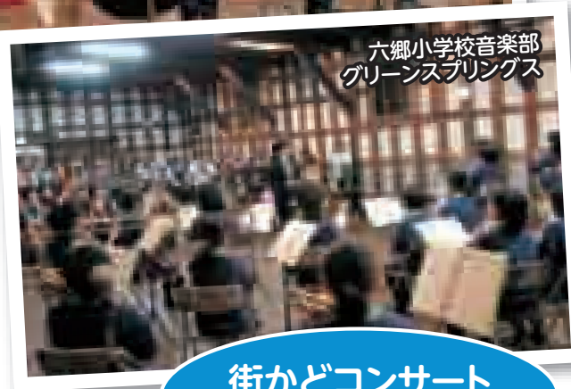
六郷小学校音楽部 グリーンスプリングス