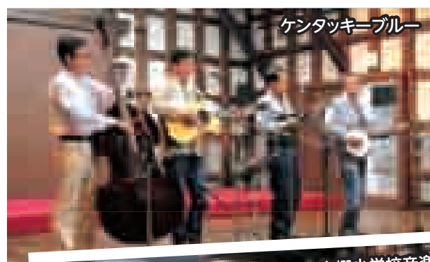
ケンタッキーブルー