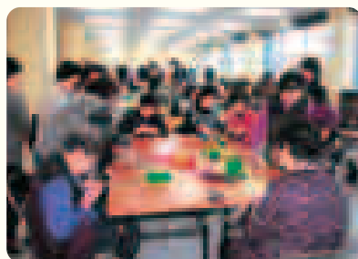
▲昨年の「みさぽーとまつり」の様子