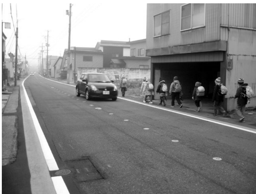
中央通り線のグリーンベルト

道幅は確保されていること、また多くの住民が子どもたちの登下校を見守ることができ、防犯効果も期待できることなどから、現行どおりでよいと考えている。