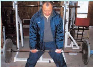
デッドリフト (床に置いてあるバーベルを、直立の状態まで引き上げる)