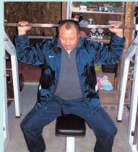
スクワット (バーベルをかつぎ、一旦しゃがんだ後に立ち上がる)