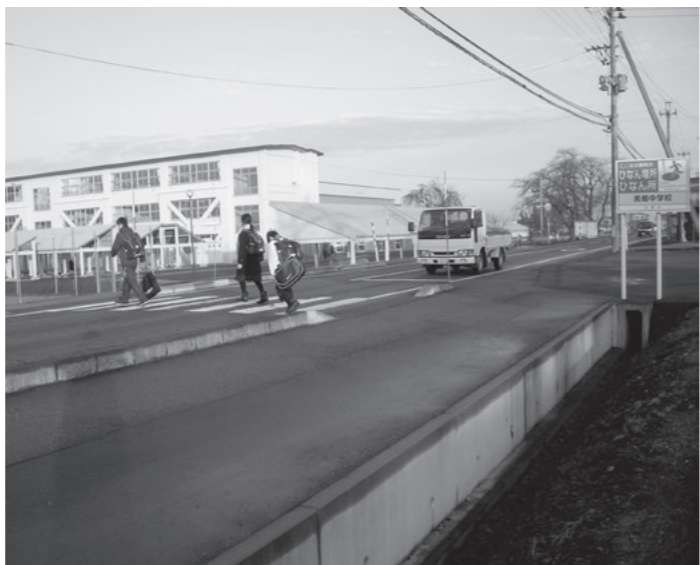
中学校前の横断歩道

は、当面、中央公園・中央体育館などで行われる大きなイベント時の簡易駐車場に利用します。冬期間は六郷地区の道路除雪の雪の一時ストックヤードとして利用します。今後、草刈りなど跡地の管理を徹底します。