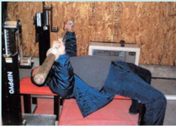
ベンチプレス (仰向けに寝た状態で、バーベルをつかんで押し上げる)

3つの方法でバーベルを持ち上げ、重量の合計を競う競技。ウェイトリフティングとは持ち上げ方が異なる。