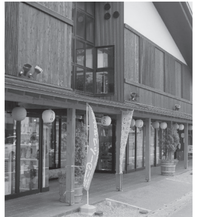
乗り合いタクシー拠点施設(湧太郎)