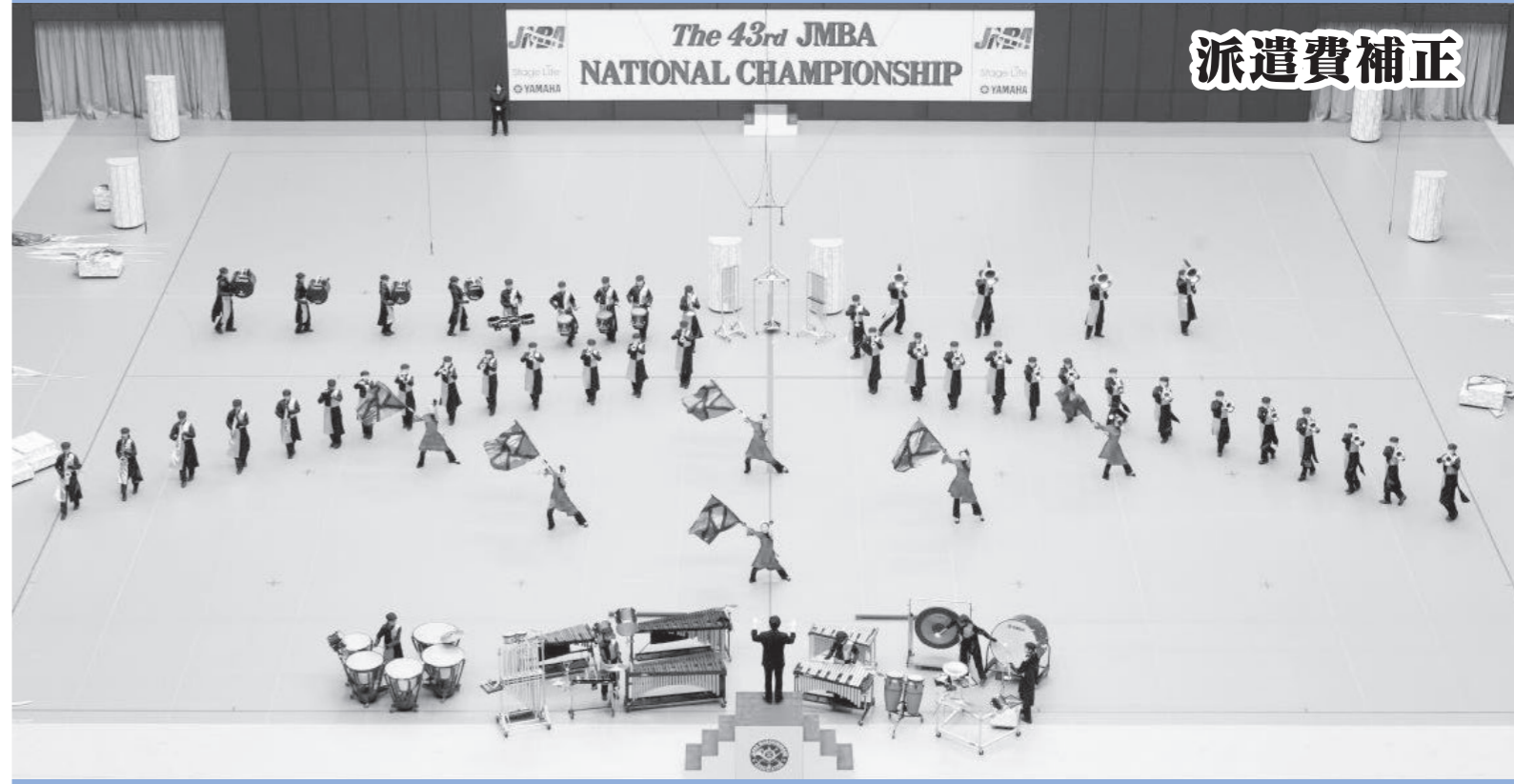
会場：さいたまスーパーアリーナ

12月定例会を、12月8日から17日までの10日間の会期で開きました。審議した議案は平成27年度美郷町一般会計補正予算や指定管理者の指定など15議案、追加提案された意見書案1件、その全てを、原案の通り同意・可決しました。また、一般質問は6議員が登壇して町政をただし、陳情1件を採択、1件を不採択としました。