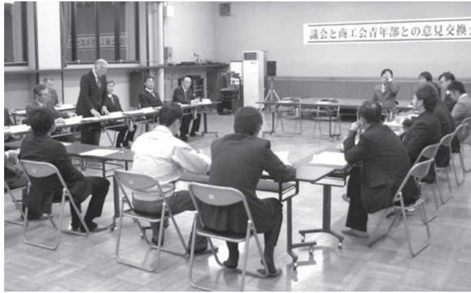
中央ふれあい館で行われた意見交換会の様子

若い世代の方々に議会の現状を理解していただき、今後のあり方について意見を伺うことや、青年部の活動などについて語りあうため、11月26日、意見交換会を開催しました。