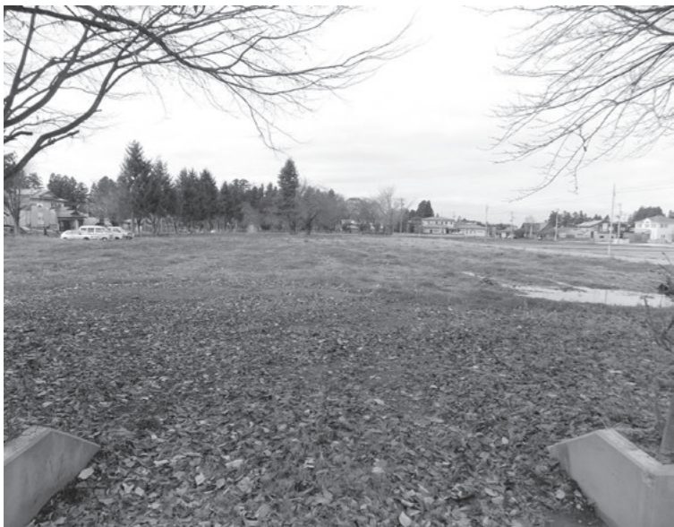
旧わくわく園跡地

住民 旧わくわく園跡地を冬季の雪捨て場として使う事はわかるが、年間を通じた利用特に夏場の有効な利用をしてほしい。また、現況は景観的に良好でない。 町の回答 跡地利用について