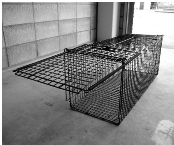
町で準備している小動物用の捕獲檻

町長 空き家に住み着く対策については、今年度1件の依頼があったが、農作物等への被害は確認されず、捕獲用檻の設置には至らなかった。