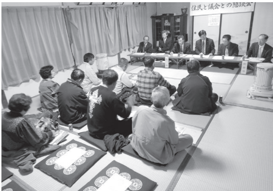
本館会館で行われた懇談会の様子

住民 消防団員になる人が減少している。団員の確保について検討してほしい。また、団員がいない集落は、一部で防火啓蒙の活動に行政協力員から協力していただいたところもあるが、検討できないか。 町の回答 各分団で新団員の勧誘を進めておりますが、難しい状況です。団員がいない