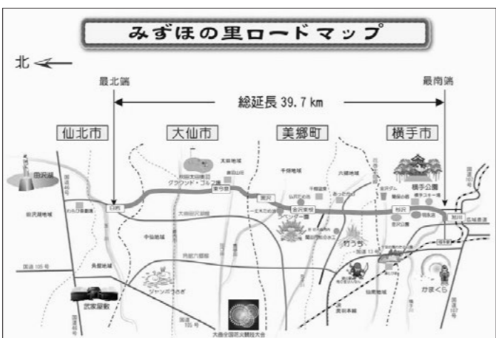
みずほの里ロードマップ

議員 みずほの里ロードの周辺には多種多様な観光スポットがあり、温泉施設も多い。町内だけでもラベンダー園や千畑温泉、あつたか山温泉、六郷の湧水群など数多くある。そこで、みずほの里ロードを国道に昇格させてはどうか。そのことについて危険箇所などの整備も進むと考えるが、町長の見解をうかがう。