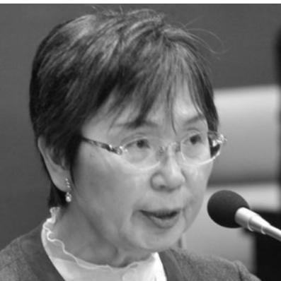
泉 美和子 議員