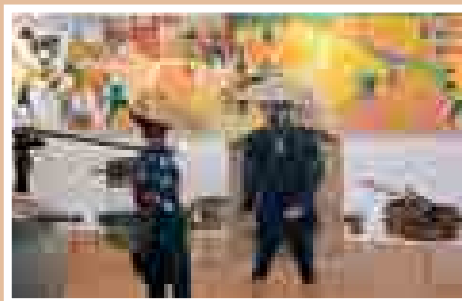
▲当時の生活の様子や使用して いた道具などが春夏秋冬に合 わせて展示されています。