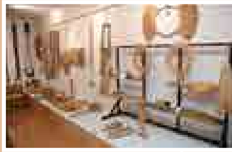
▲県内有数の展示数を誇る、 わら細工の展示室です。