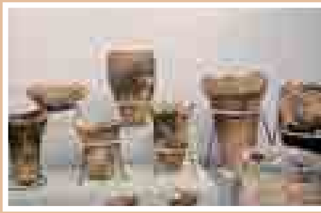
▲町内で発掘された土器や石器が 展示されています。