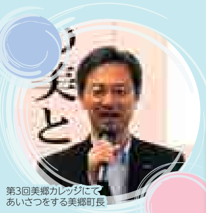
第3回美郷カレッジにてあいさつをする美郷町長

昨年暮れの話です。六郷高校の校長先生より、生徒に向けて扁額を作成したい由で揮毫を依頼されました。まったく字に自信はありませんので迷いましたが、結果的にお受けしました。美郷町合併十周年記念で美郷大使の方々に揮毫を無理にお願いした立場上、逆の立場になりお断りするのは、あまりに都合良いと思っただけです。選定した言葉は「博学篤志」。大切な高校生時代に、広く(博く)学んで、熱心に(篤く)志