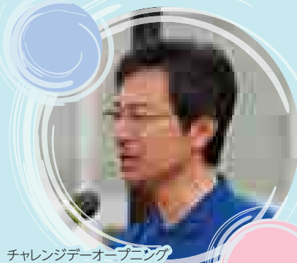
チャレンジデーオープニング セシモニーで挨拶を述べる 美郷町長

某飲料メーカーに「プレミアム○○○」というビールがあります。ビールを飲まれる方は「ああ、あれね」とすぐ分かると思います。多くの商品が生まれては消えていくビール戦国時代の中、高い評価を得ているように思うビールです。私も「お気に入り」のビールの一つで、たまたまに飲んでいました。小売酒販店に育ったためですが、私は未成年でも、味は知らなくても（本当か？）ビールの