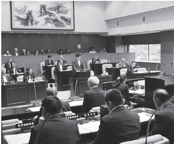
一般質問の様子（一番奥が傍聴席）

美郷町議会では、住みよいまちづくりのために、予算や条例などの審議を行っています。行政に対する一般質問もあります。