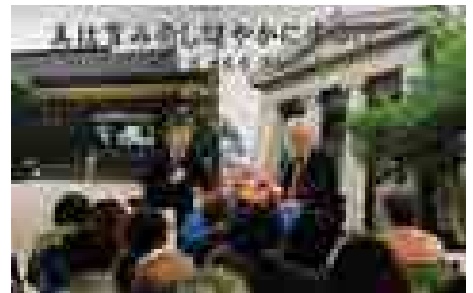
■美郷カレッジの様子