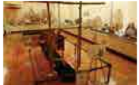
■タイ王国文化展の様子

まちなかエリア（六郷中心市街地）の商業活性化を図るため、まちなかエリア活性化実行委員会の開催および空き店舗等の利活用を支援します。