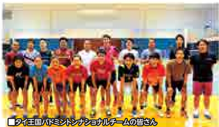
タイ王国バドミントンシナショナルチームの皆さん

来町し、美郷フェスタの開催に合わせ10月27日には美郷総合体育館リリオスで交流物産展を行いました。今後も、相互の地域資源を活用した双方向での交流を進めていきます。