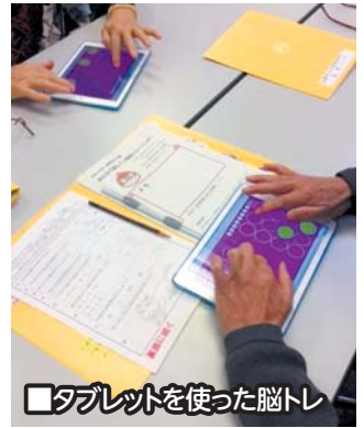
□タブレットを使った脳トレ