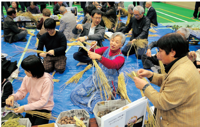
■ 昨年のワークショップの様子

今回は、国の伝統的工芸品に指定されている「奥会津編み組細工」など、ものづくり技術の継承と普及に力を入れている福島県三島町の町長をお招きして、町の取り組みについて語っていただきます。ぜひこの機会に、あたたかい「手しごと」に触れてみてください。