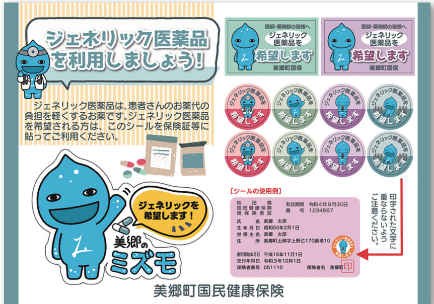
■ジェネリック医薬品希望シール