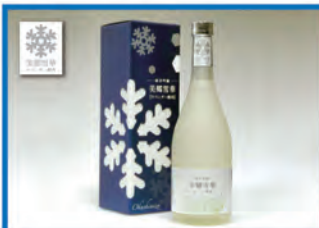
純米吟醸「美郷雪華」