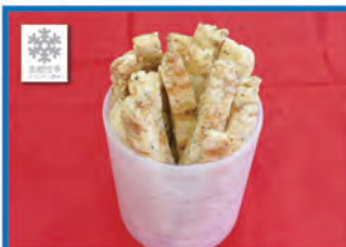
美郷雪華青のリクッキー