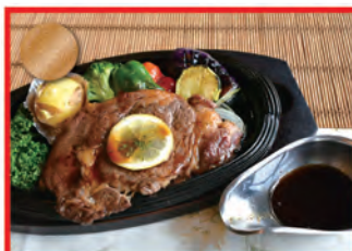
スタミナたれ極美