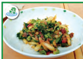
チンツァイトラジ ムッチム