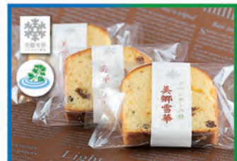
美郷雪華パウンドケーキ