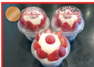
いちごフローズンアイス