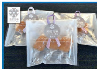
美郷雪華キャラメル