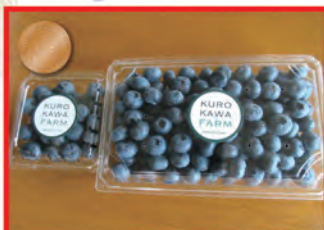
くろかわファームブルーベリー