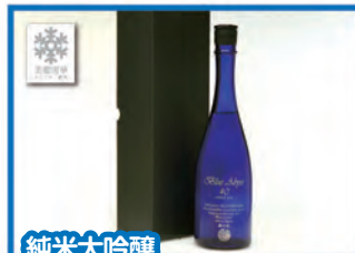
純米大吟醸「美郷雪華」Blue Abyss