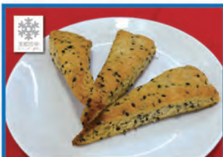
美郷雪華ごまチーズスコーン