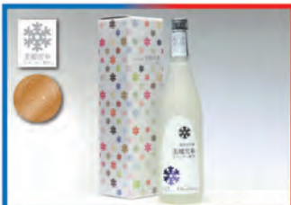
純米大吟醸「美郷雪華」