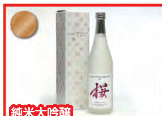
純米大吟醸 「桜酵母 ミサトヨシノ」