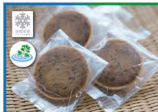
美郷雪華こまちさぶれ