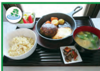
薬膳ハンバーグ定食