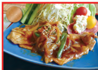
生姜焼きのたれ極美