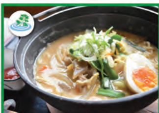
やくぜん酒粕豚汁