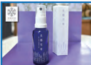
美郷雪華ルームフレグランス