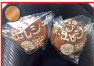
亀太郎の窯出しシユー