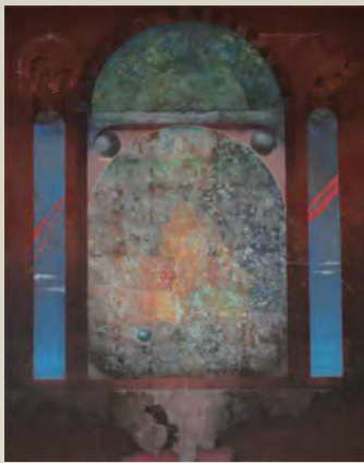
渋谷重弘「星食修正説」1999年