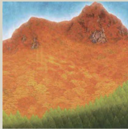
高橋清見「秩父幻秋」2000年