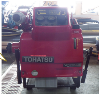
トーハツVC52AS 製造番号5896▶