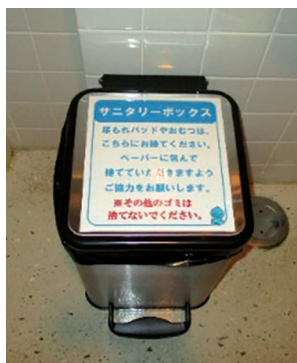
▲サンタリーボックス