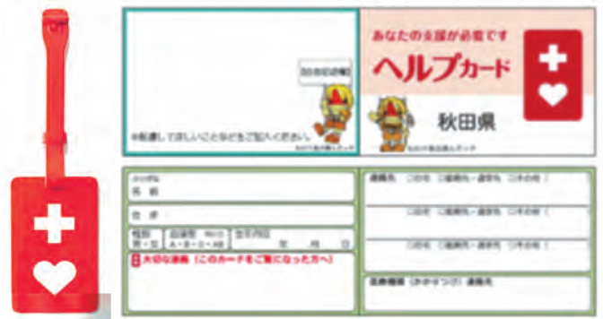
▲ヘルプマーク ▲ヘルプカード