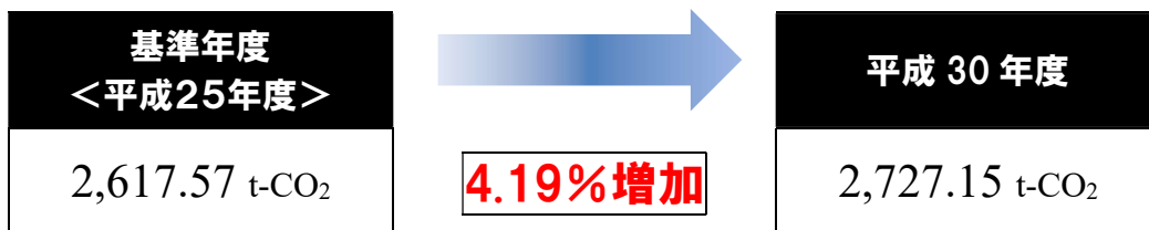
◆要因別温室効果ガス排出量比較表