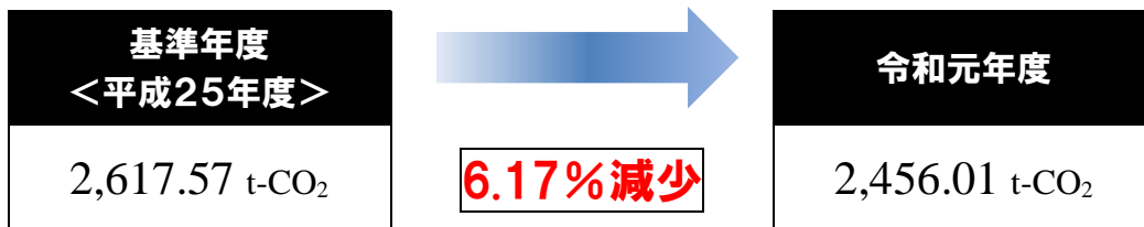
◆要因別温室効果ガス排出量比較表