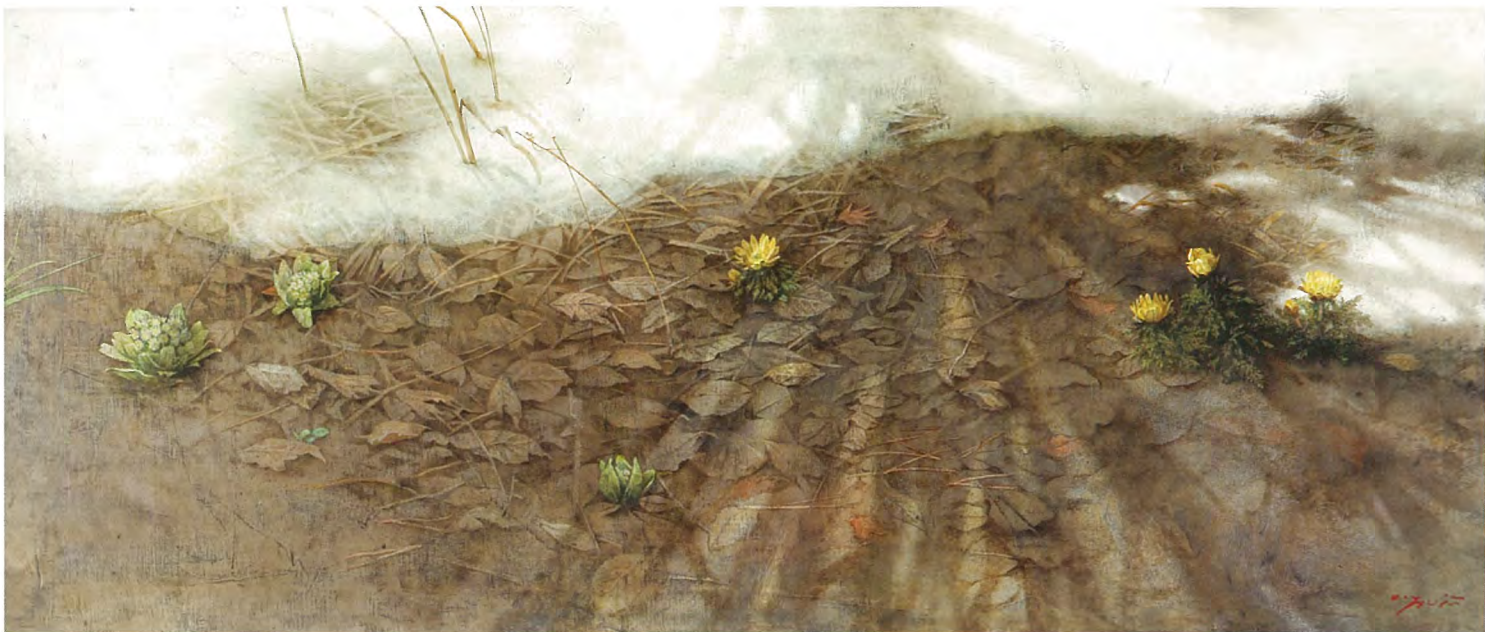
『雪溶けの頃』50.0×116.7cm 油彩・キャンバス