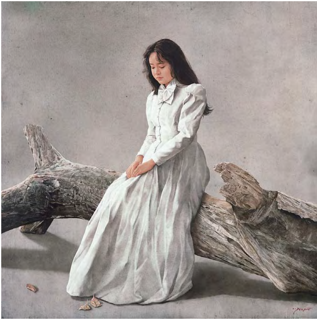
「白」 91.0×91.0cm 油彩・キャンバス 学校法人 佐藤栄学園蔵