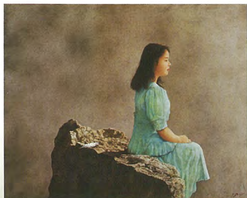
『旅立ちの朝』72.7×91.0cm 油彩・キャンバス